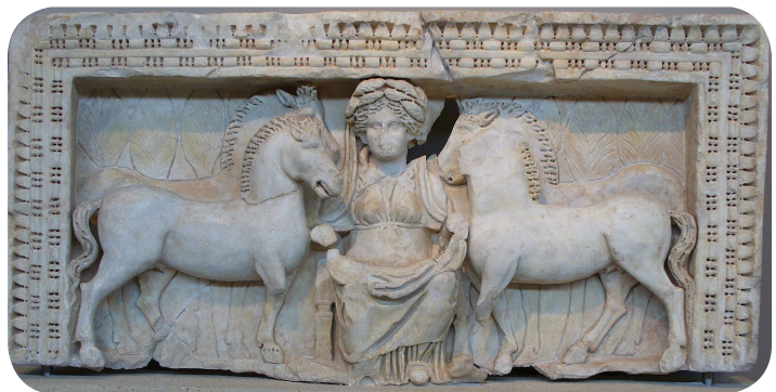
Fig 1 - Relief d'Epona à Thessalonique (Grèce), IVe siècle, Musée archéologique de Thessalonique.

Il est fortement déconseillé de mettre des images pour mettre des images. Nous n'avons plus besoin d'images pour lire un livre. Celles-ci doivent servir de support à votre rédaction. Si vous travaillez par exemple mon sujet porte sur Epona et son culte, l'image ci-dessous est pertinente. En revanche, si vous travaillez sur la représentation moderne d'Epona, celle-ci ne l'est